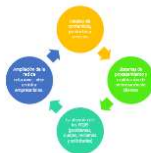
Figura 3. Formas de transaccionar por medio de TIC

En cuanto a la penetración en nuevos mercados se encuentra que las TIC han permitido modificar las formas de realizar las transacciones como: