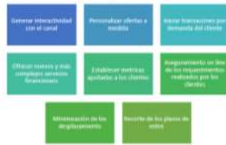
Figura 2. Bondades de las TIC

amplía la cobertura y se mejora la comunicación con clientes potenciales. Debido a que las TIC han permitido: